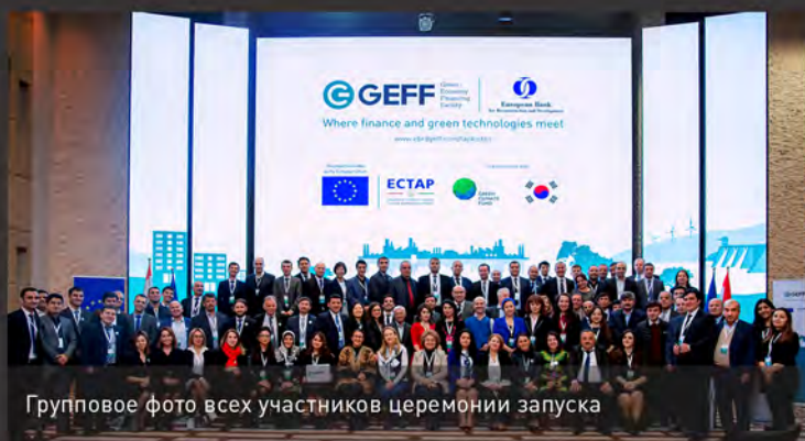
Групповое фото всех участников церемонии запуска