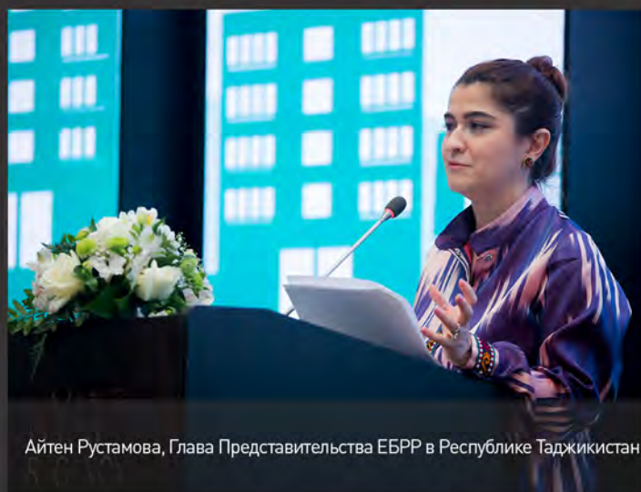
Айтен Рустамова, Глава Представительства ЕБРР в Республике Таджикистан

"... GEFF Таджикистан является уникальным продуктом, поскольку сочетает в себе инвестиции в зелёные технологии и продвижение конкурентоспособной экономики. GEFF Таджикистан способствует внедрению в Таджикистане глобальных, передовых практик и технологий..."