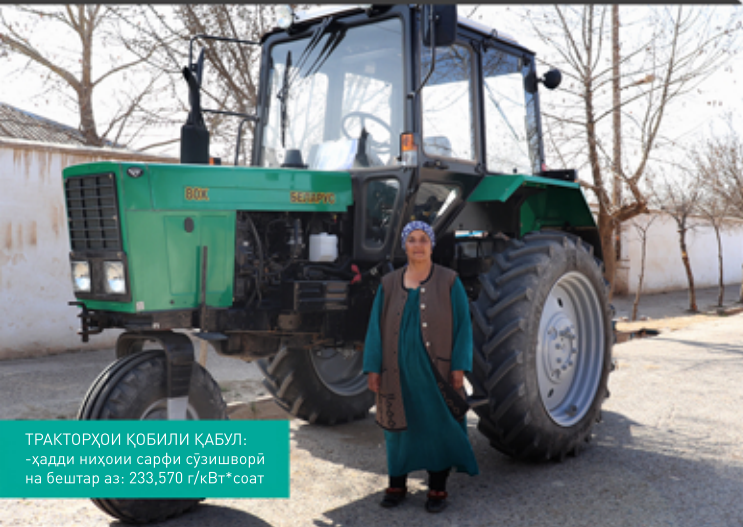
ТРАКТОРҲОИ ҚОБИЛИ ҚАБУЛ: -ҳадди ниҳии сарфи сузишворӣ на бештар аз: 233,570 г/кВт*соат